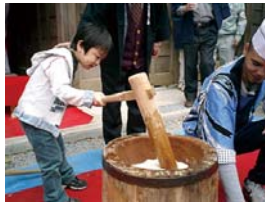
かえし手イメージ写真