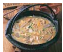
豚汁 100杯 55,000円