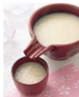
甘酒 100杯 50,000円