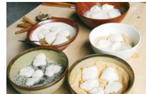
お餅イメージ写真