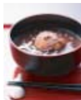
おしるこ 100杯 55,000円