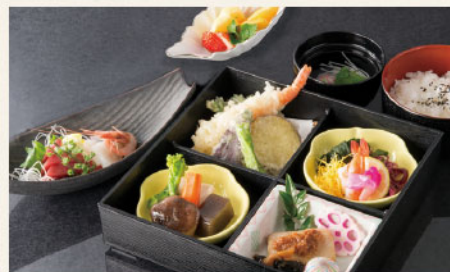
立波 3,496円 ▶ 3,000円 (税込)