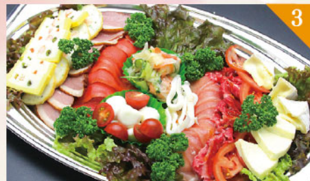
3 洋風オードブル 3,800円(税込) 容器サイズ: 290×430mm