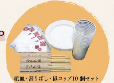
紙皿・割りばし・紙コップ10個セット

今だけ! 1セットに「お手軽4点セット」もサービスでお付けいたします。 お手軽4点セット 500円 ▶ 0円