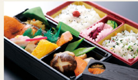
秋ヶ瀬 メインのおかずが見える中窓容器 サイズ: 217×94×H45mm/2段 銀鮭、白米、五色ご飯、香の物、季節の煮物、豚牛蒡巻き、厚焼玉子、あしらい