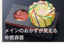
メインのおかずが見える 中窓容器