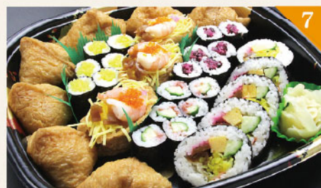
7 助六桶 4,000円(税込) 容器サイズ: 310×310mm