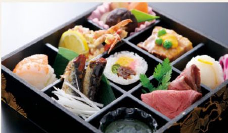
芝川 サイズ: 195×195×H45mm 海老手毬、太巻、キス手毬、季節の煮物、和風揚げ物、ローストビーフ、豚の角煮、肴生姜煮、和スイーツ、あしらい