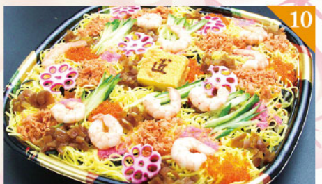
10 チラシ寿司 4,000円(税込) 容器サイズ: 310×310mm