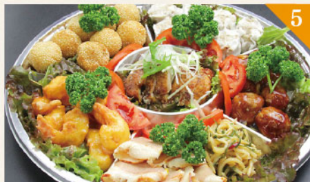
5 中華風オードブル 4,000円(税込) 容器サイズ: 直径 380mm