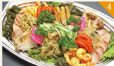
4 中華冷菜 3,500円(税込) 容器サイズ: 290×430mm