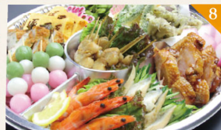
8 和風オードブル 4,000円(税込) 容器サイズ: 直径 380mm