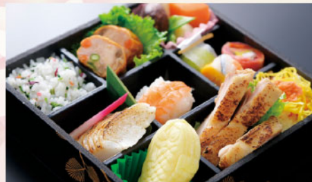
彩雲 サイズ: 195×195×H45mm 海老手毬、五色ご飯、チラシ寿司、季節の煮物、若鶏焼き、彩り和前菜、チキンロール、和スイーツ、焼肴、和菓子、あしらい