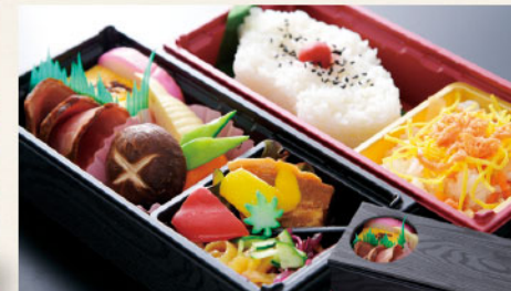
味彩 メインのおかずが見える中窓容器 サイズ: 217×94×H45mm/2段 ローストポーク、豚角煮、白米、ちらし寿司、赤蒲鉾、厚焼玉子、あしらい