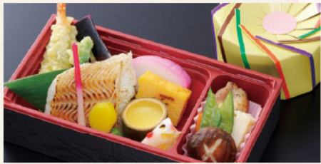
花くるま弁当 宝登 サイズ: 217×116×H50mm 焼き魚、天婦羅盛合せ、味覚串、季節の煮物、厚焼玉子、赤蒲鉾、和菓子、華蓮根、あしらい