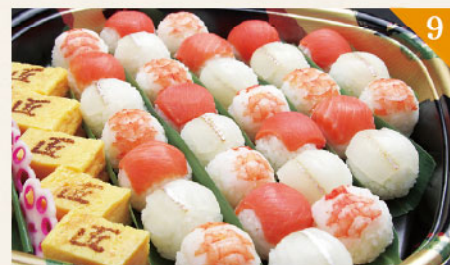
9 手毬桶 4,500円(税込) 容器サイズ: 310×310mm