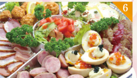
6 おつまみセット 4,000円(税込) 容器サイズ: 直径 380mm