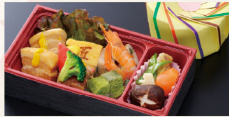
花くるま弁当 曳山 サイズ: 217×116×H50mm 豚角煮、豚肉牛蒡巻き、有頭海老、季節の煮物、厚焼玉子、抹茶わらび餅、あしらい