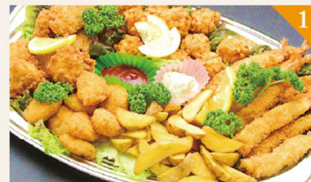
1 洋風ミックスフライ 3,500円(税込) 容器サイズ: 290×430mm