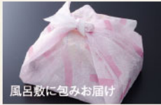
風呂敷に包みお届け