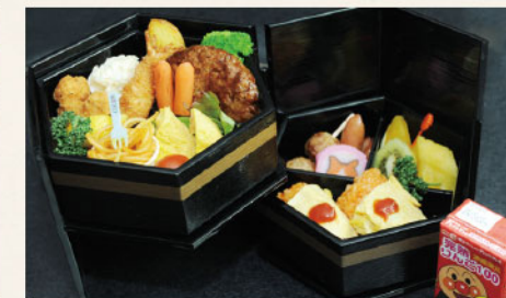
お子様膳 2,160円 ▶ 1,800円 (税込)