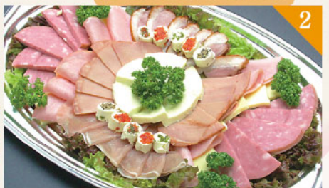
2 ハムとチーズのオードブル 3,500円(税込) 容器サイズ: 290×430mm