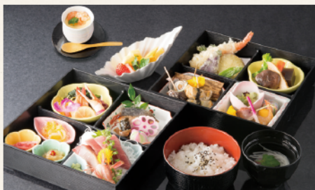
桔梗 6,480円 ▶ 5,000円 (税込)