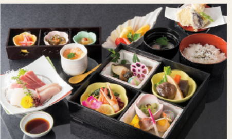
花菱 5,400円 ▶ 4,500円 (税込)