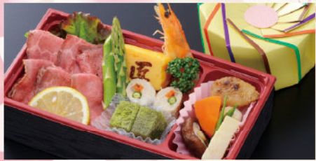
花くるま弁当 けやき サイズ: 217×116×H50mm ローストビーフ、豚肉牛蒡巻き、季節の煮物、厚焼玉子、有頭海老、和菓子、あしらい